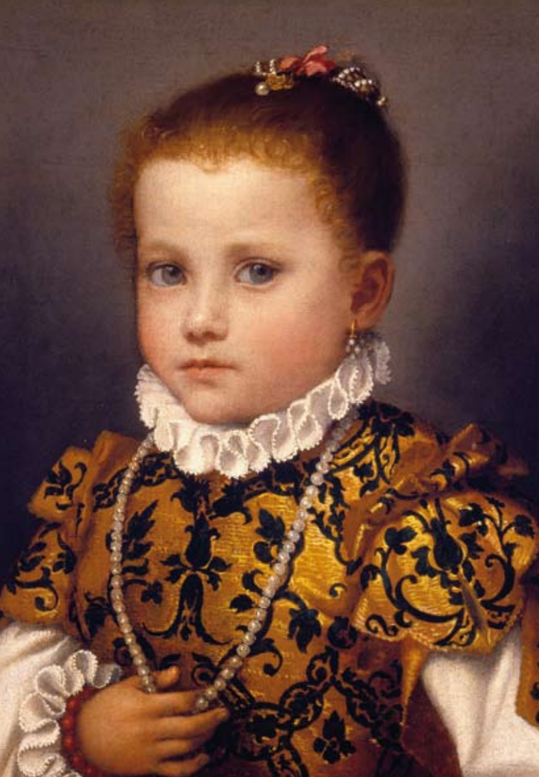
Giovanni Battista Moroni - Ritratto di bambina di casa Redetti